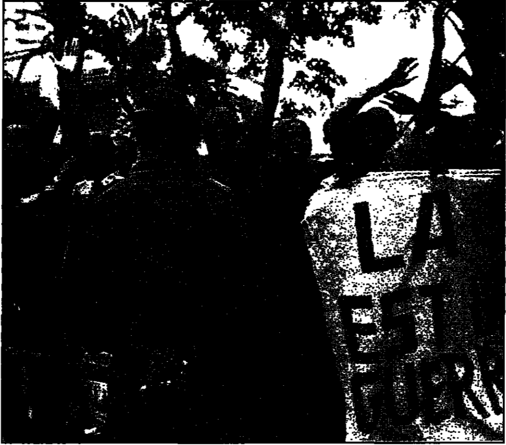
مقاتلون زائيريون يشاركون في مظاهرات تخلت أمس في كينشاسا بقيادة الرئيس موبوتو سيبي سيكو

أوبويماشي - كينشاسا - لوساكا - وكالات: وصل نائب ميجيكي نائب رئيس جنوب أفريقيا إلى مدينة لوبومباشي في جنوب شرقي زائير الجمعة لتلقاء لوران كابيلا زعيم التمردين.